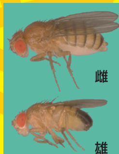
キイロショウジョウバエ 野生型